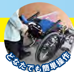
どなたでも簡単操作