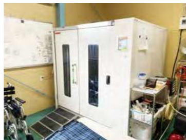
(中型洗浄・乾燥機TC-2001)

さらなる業務効率化とメンテナンスの品質向上を図るため、弊社新製品の「中型洗浄・乾燥機 (TC-2001)」をご導入いただきました。長年ご利用いただいていた「リフレッシャー」からの入れ替えにより、一度に洗浄できる物量も増加し、カゴ台車のまま洗浄・乾燥ができるようになったことで、洗浄工程も大幅に効率化されました。(埼玉県所沢市)