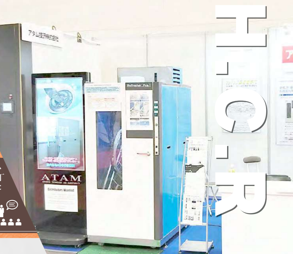
[RF-101] リフレッシャー・ライト