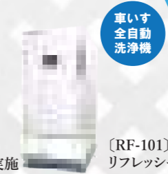
車いす全自動洗浄機