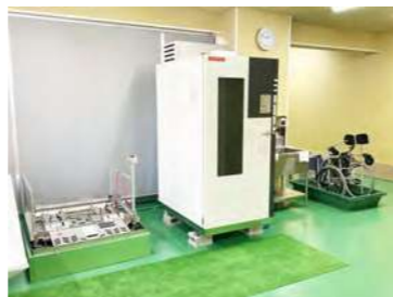
(ピッカーラーFW-201/リフレッシャーProII RF-053)

介護用品・福祉用具などを扱うヘルスレント事業の新規立ち上げに伴い、洗浄機・乾燥機等から、各種機器をご導入いただきました。これによりレンタル品の自社メンテナンス作業が可能となり、作業効率や洗浄品質が向上しました。洗浄・乾燥に加えアルコール消毒も行うため、利用者の方が快適に生活できる介護用品・福祉用具をご提供されています。(東京都足立区)